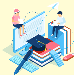
Books & Study Material