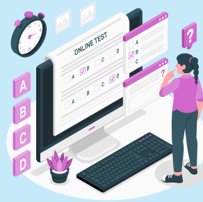
Online Test Series & Quiz