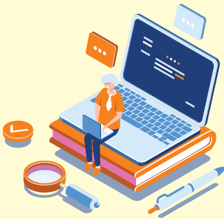
Live/Recorded Online Program