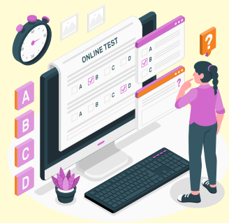
Online Test Series & Quiz